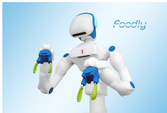
▲人型協働ロボットFoodly