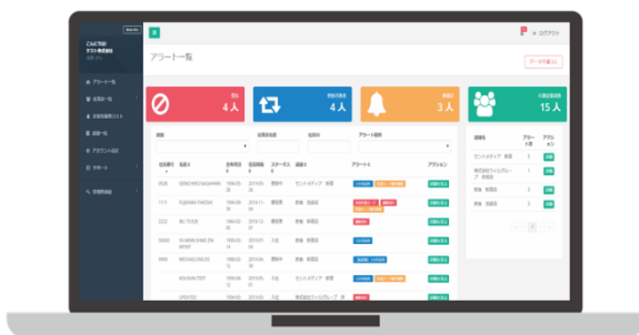
管理者(企業側)画面

在留カードの有効期限が近づいた従業員がいた場合、システムより従業員と事業所、本社へ自動でアラートメールが送信されます。