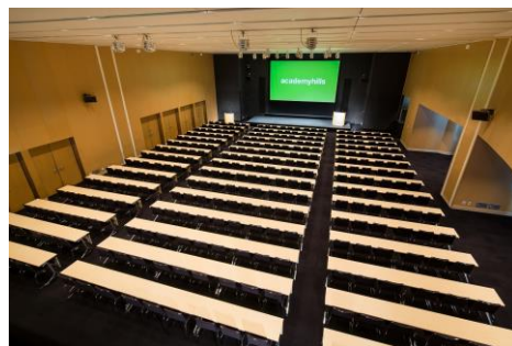
※セッション会場イメージ