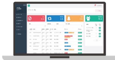
管理者(企業側)画面