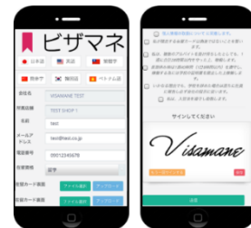
在留カードアップロード画面 (就労者入力画面)